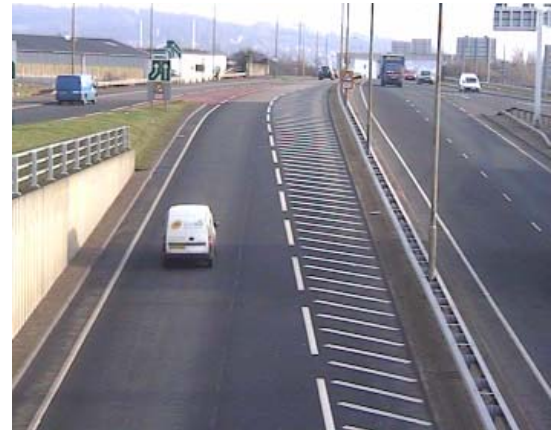
Die für die Bewegungsvorhersage verwendete CCTV-Szene

Innerhalb des H.264 Encoder ist die Funktion Bewegungsvorhersage das rechenaufwendigste und für die Leistung das am meisten entscheidende Element. Die Bewegungsvorhersage ist insgesamt ein sehr komplexer Vorgang. Viele Encoder auf Basis Echtzeit-Software oder DSP reduzieren daher häufig die Suchbereiche der Bewegungserkennung oder sie benutzen nur einen eingeschränkten Suchalgorithmus, damit die Echtzeitleistung erhalten bleibt. Dies führt jedoch häufig zu schlechter Videoqualität und zu einer deutlich verringerten Kompression.